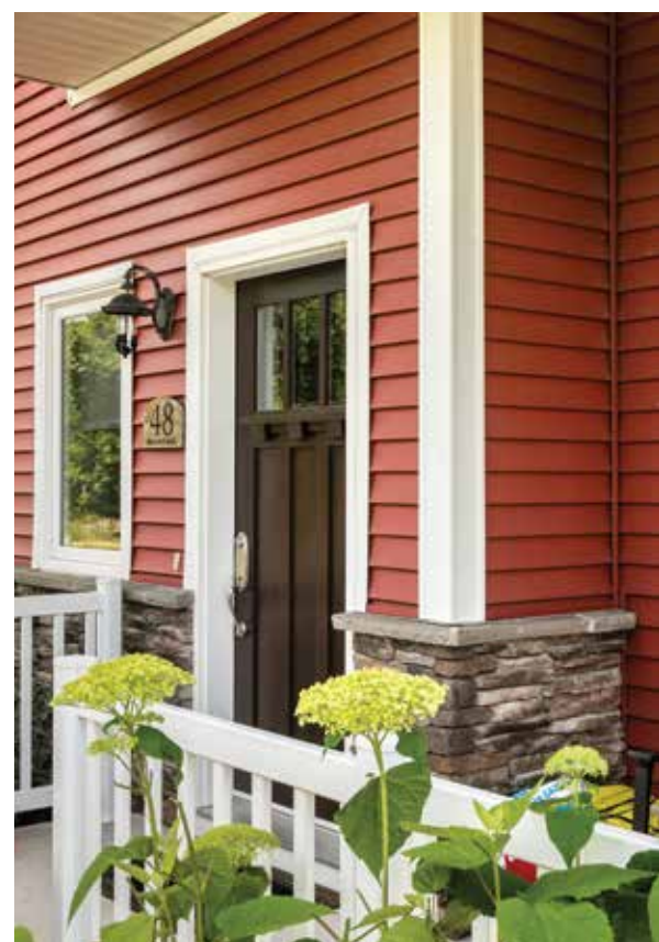
Revêtement Estate MC D4 en Séquoia, moulures de vinyle Royal MD en Blanc

La résine de PVC est l'élément essentiel de notre revêtement de vinyle et se compose au départ de deux matières abondantes : le chlore produit avec du sel ordinaire et l'éthylène dérivé du gaz naturel. La résine de PVC est optimisée par l'ajout de divers autres ingrédients pour fournir un produit d'extérieur fiable qui peut prendre toutes sortes de formes et qui dure toute une vie.